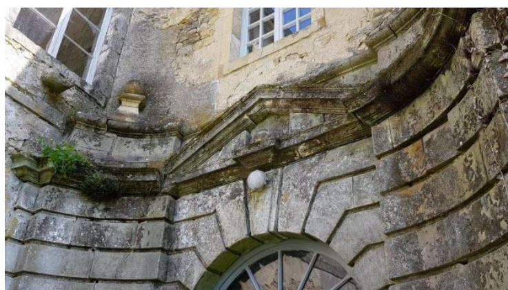
L'abbatiale date du XIIe siècle.

Après avoir bénéficié de la mission Bern en 2019 via son loto du patrimoine, à hauteur de 33 000 €, l'abbaye de Cherlieu a été retenue par la fondation de l'association des Vieilles Maisons françaises (VMF) dans le cadre de sa collecte nationale de fonds, « Fous de patrimoine », lancée en 2013. À ses côtés : le château de Braux-Sainte-Cohière dans la Marne, le manoir de l'Aumônerie en Seine-Maritime ou encore le château de Goudourville, dans le Tarn-et-Garonne. Du 25 janvier au 5 mars, et même au-delà, il sera possible de faire un don sur le site fousdepatrimoine.fr ou bien par chèque par voie postale pour soutenir la restauration de ce joyau cistercien, autrefois considéré comme l'un des plus beaux de Franche-Comté.