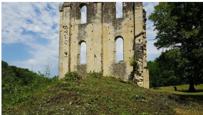
Un pan de mur a survécu.

Les trois particuliers, passionnés d'art et d'histoire, consacrent tout leur temps à restaurer et faire connaître l'abbatiale, fondée en 1131, ravagée durant la Révolution, et qui servit même de carrière par la suite. Tous cultivent des « ambitions terribles » pour le site, à fort potentiel touristique : créer un réseau d'abbayes, inscrire Cherlieu dans un circuit des monuments historiques du département, étendre les visites guidées, développer des concerts ... « C'est un gouffre insondable au plan du temps et au plan financier », confie Gilles Moreau.