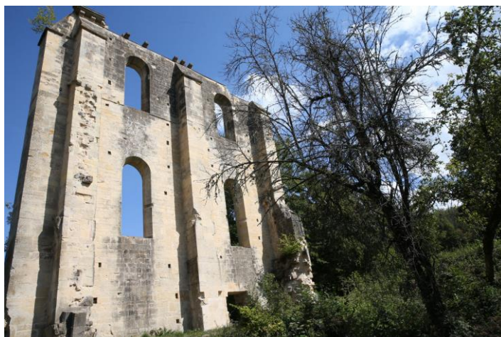
Les merveilleux vestiges de l'abbaye cistercienne de Montigny-lès-Cherlieu méritent le détour.

L'abbaye de Cherlieu, à Montigny-lès-Cherlieu, a été sélectionnée par la fondation VMF dans le cadre de sa collecte de fonds nationale « Fous de patrimoine ». Chacun est invité, à hauteur de ses moyens, à participer à la restauration de ce joyau cistercien en péril.