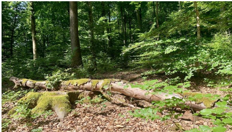
Les arbres morts, refuges pour la biodiversité

Le défi aujourd'hui pour les forestiers est d'imaginer l'avenir. Un outil, baptisé ClimEssences, leur permet mesurer l'impact probable des changements climatiques sur la répartition des essences et de connaître leur résistance face aux sécheresses. D'après cet outil, d'ici 70 ans, le chêne sessile serait moins adapté à la forêt de Cherlieu.