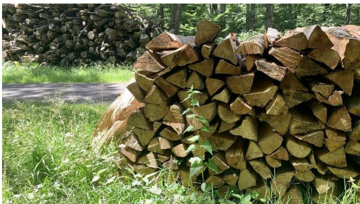
Les bois sont vendus surtout à des filiales locales

Ce résultat est le fruit d'un long travail de sélection . "Il faut veiller à ce que les chênes, qui démarrent lentement, ne soient pas empêchés par d'autres essences poussant plus vite, explique Fabrice Bossi, également technicien forestier territorial à l'ONF. À partir de 50 ans environ, les plus beaux chênes sont repérés et ils seront récoltés en moyenne à 150 ans."