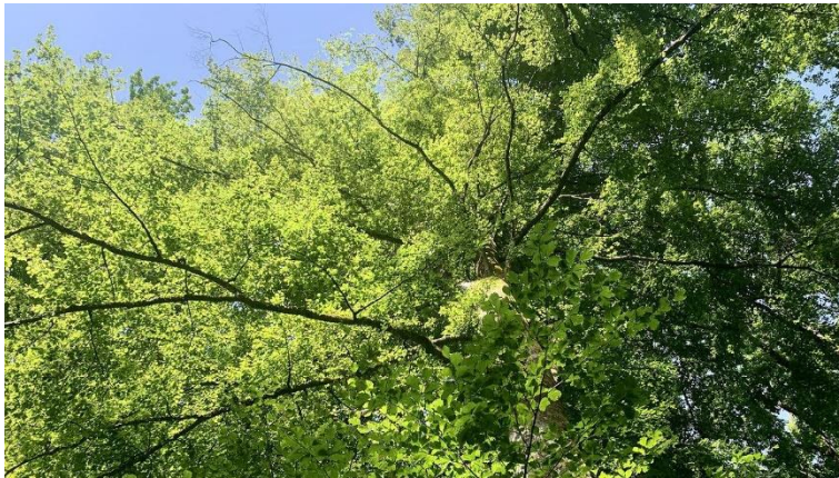
Début de chararose sur un frêne