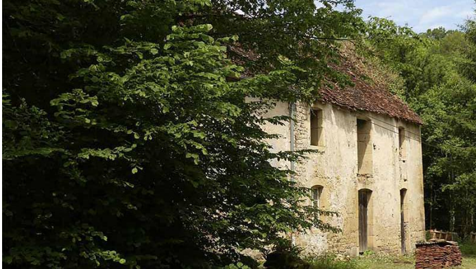
La Porterie, l'un des bâtiments annexes de l'abbaye