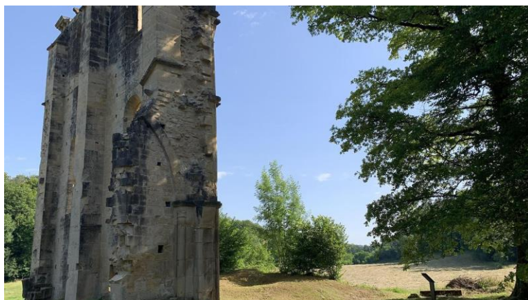
Le mur du transept nord de l'église abbatiale