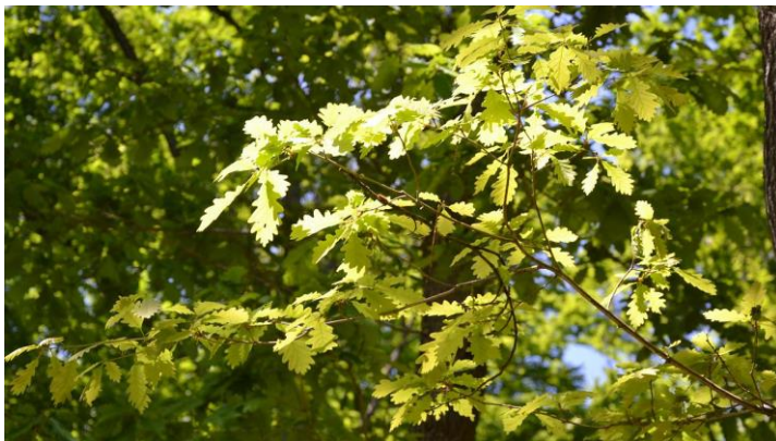
Gros plan sur le chêne