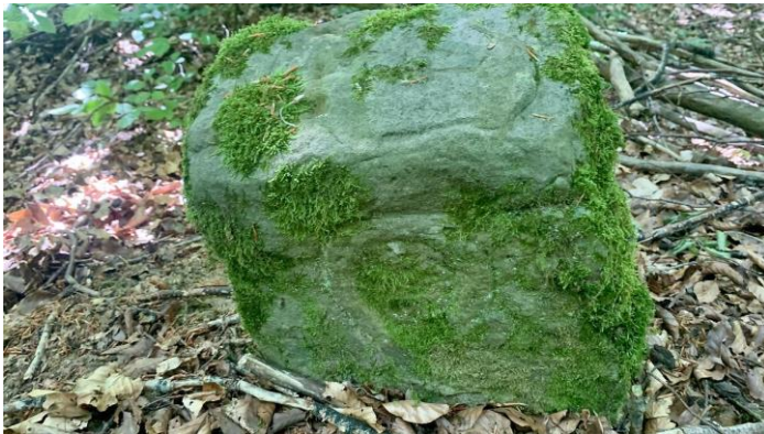
Ancienne borne