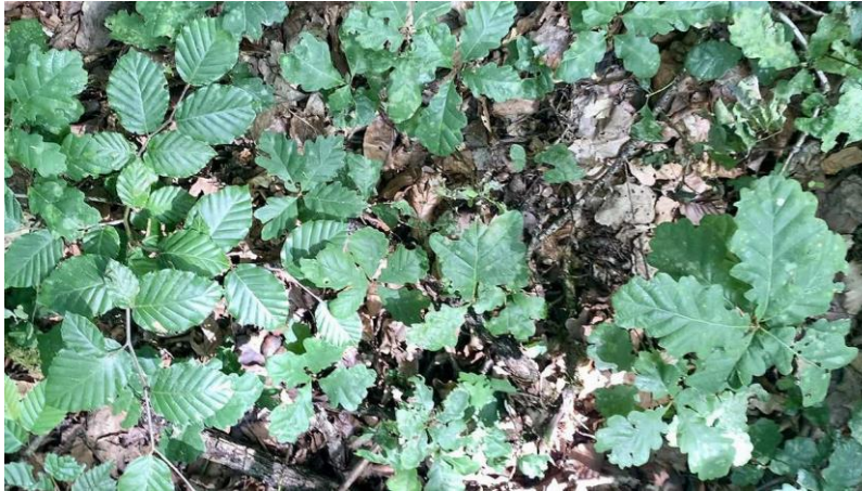
Régénération naturelle de hêtre et chêne