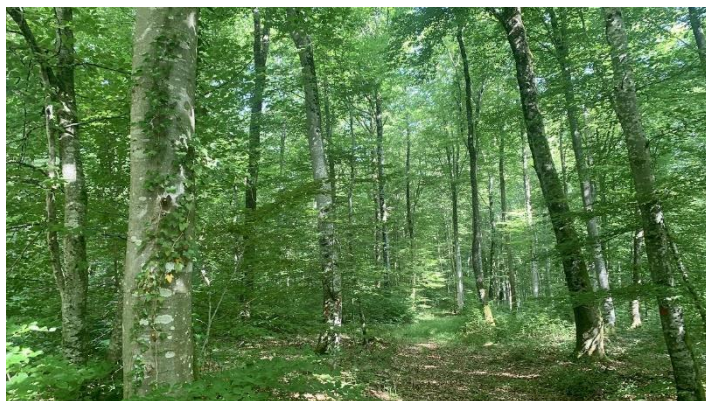
La hêtraie de Cherlieu