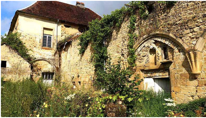
Les vestiges du cloître.