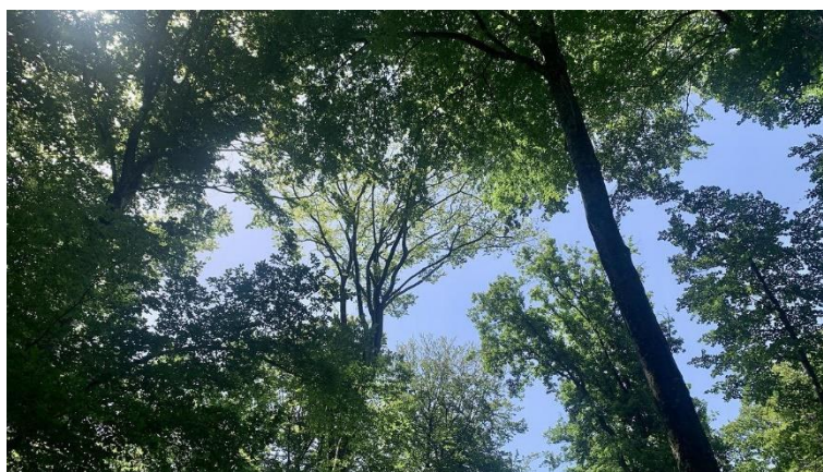
Jeux de lumières dans la canopée de la forêt de Cherlieu

Une croissance lente et régulière permet par ailleurs d'obtenir des grains très fins , provoquant des interactions subtiles entre le bois et l'alcool. Le chêne de qualité merrain fait partie de l'élite des chênes français. Il représente moins de 1% du volume de bois vendu chaque année, toutes essences confondues. Les qualités moindres partent en ébénisterie voire chez les fabricants de cercueil !