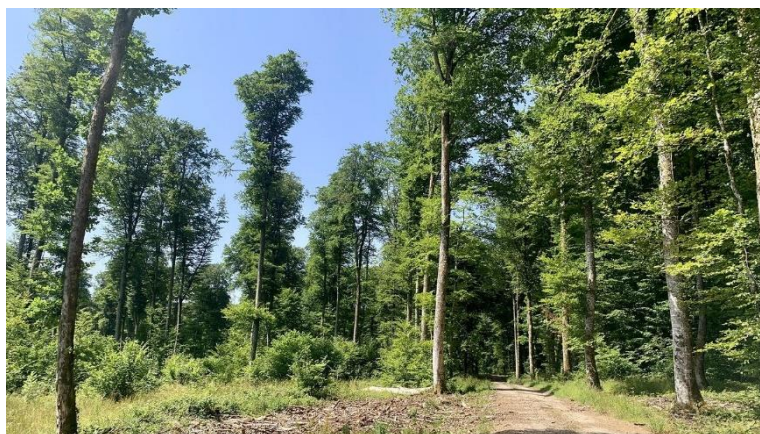
Vue générale sur la chênaie-hêtraie de Cherlieu